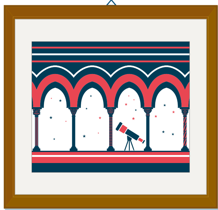
Cattedrale di Santa Maria Nuova Monreale, 1174